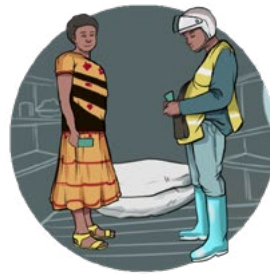
Transaction dans la boutique du SPG ETSO MBONG