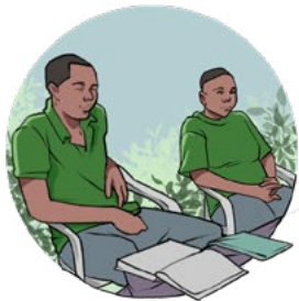
Discussion de groupe avec quelques membres du groupe local de Santchou

L'agriculture biologique vise une exploitation durable des ressources locales, le maintien de l'état de l'environnement et la santé des travailleurs. Elle se révèle une alternative intéressante pour beaucoup de petits producteurs n'utilisant pas d'intrants chimiques. Des chaînes de valeur basées sur la certification biologique par des tiers, orientées sur des marchés d'exportation se développent progressivement depuis une trentaine d'années à travers le monde. Cependant, les cahiers des charges à respecter sont très lourds et non adaptés à la petite agriculture familiale et aux exigences de consommateurs locaux. C'est dans ce contexte qu'a émergé au Cameroun le SPG Etso Mbong . Il s'agit d'un organisme de certification local et participatif en agriculture biologique regroupant plusieurs catégories d'acteurs, notamment les producteurs, la société civile et les représentants des consommateurs. Leur vision commune est présentée à travers leur slogan « Mangeons bio, vivons longtemps ».