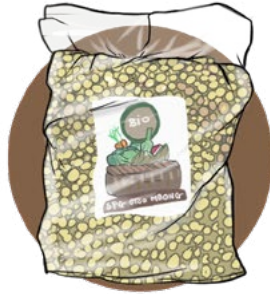
Maïs certifié bio par SPG ETSO MBONG