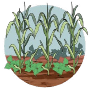
Champ d'association Maïs et haricots en agriculture biologique d'un membre du SPG ETSO MBONG