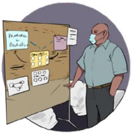
Présentation du mécanisme de vérification de la conformité par le coordonnateur du GADD