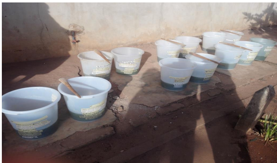
Préparation des sous produits des EM